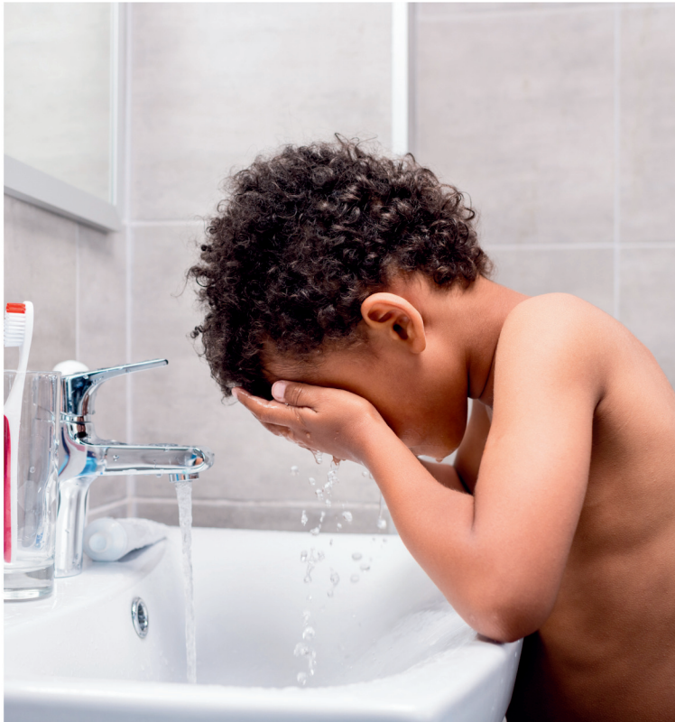
lavarsi il viso