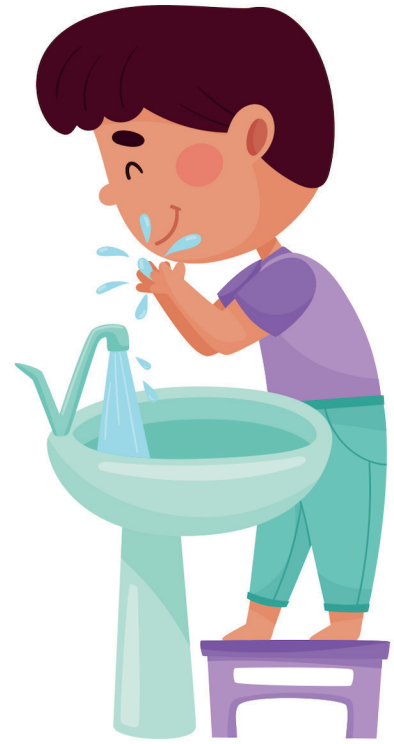
lavarsi il viso