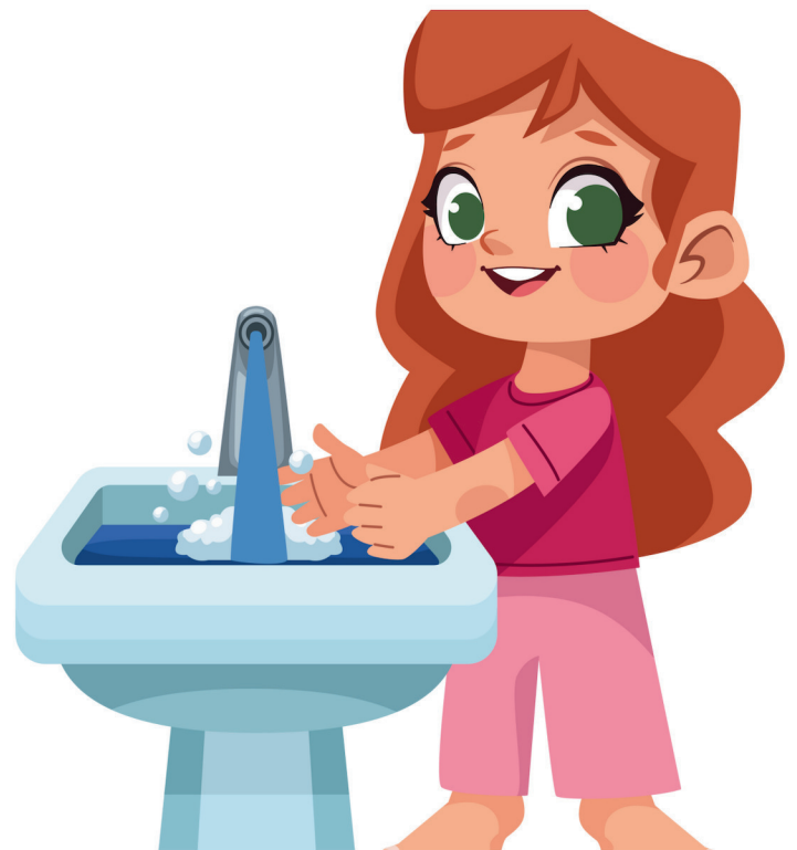
lavarsi le mani