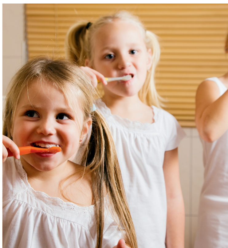
lavarsi i denti