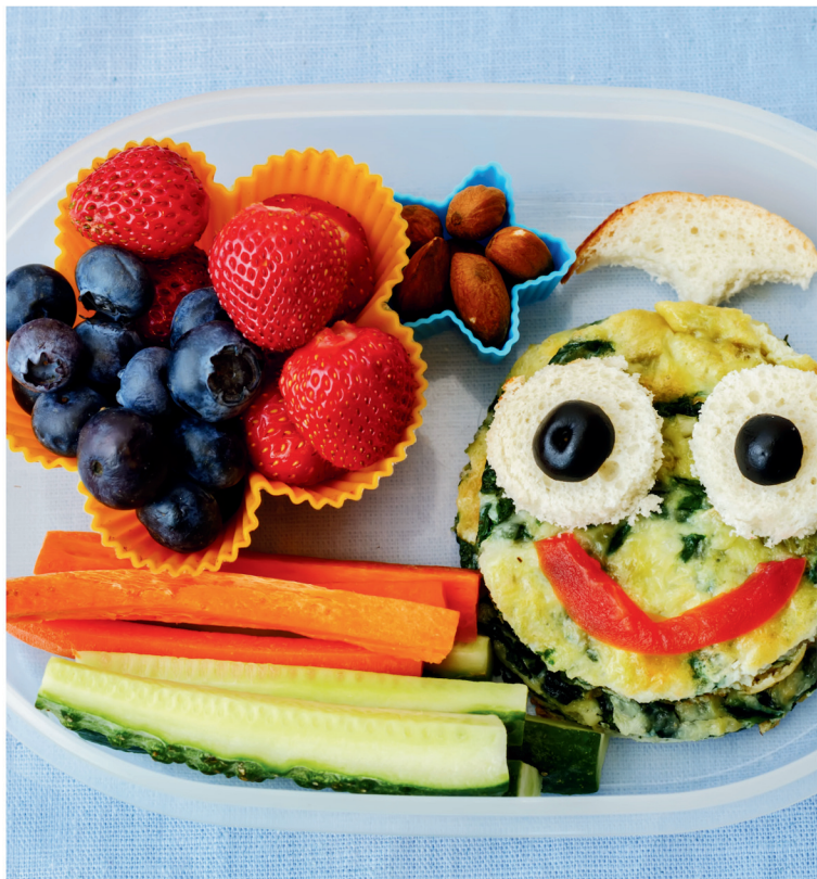
prepararsi la merenda