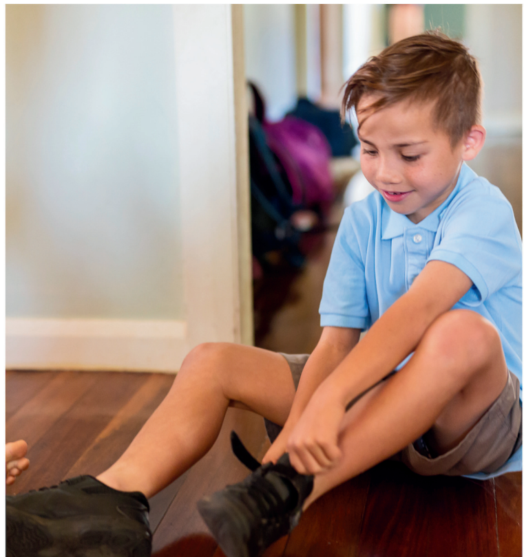
mettersi le scarpe