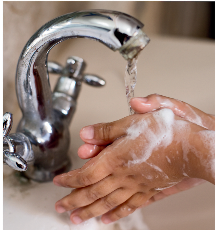
lavarsi le mani