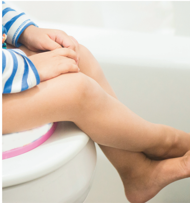
andare in bagno