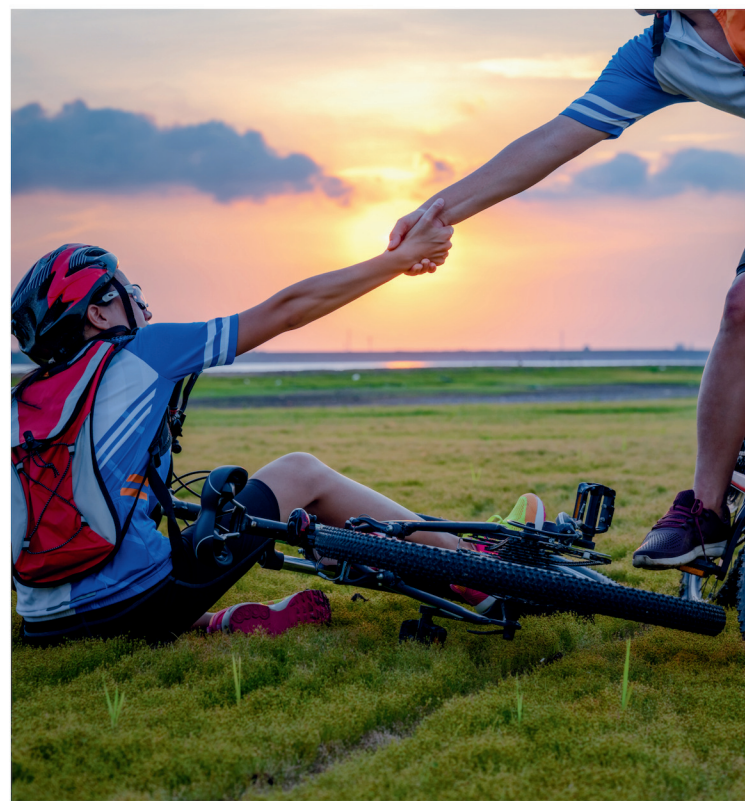
učiniti dobro djelo