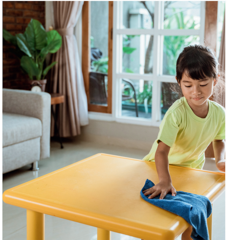
spremiti radni stol