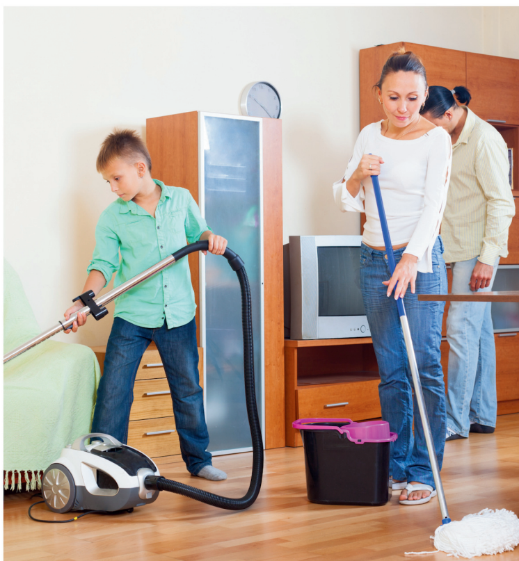
doprinijeti kućnim obavezama