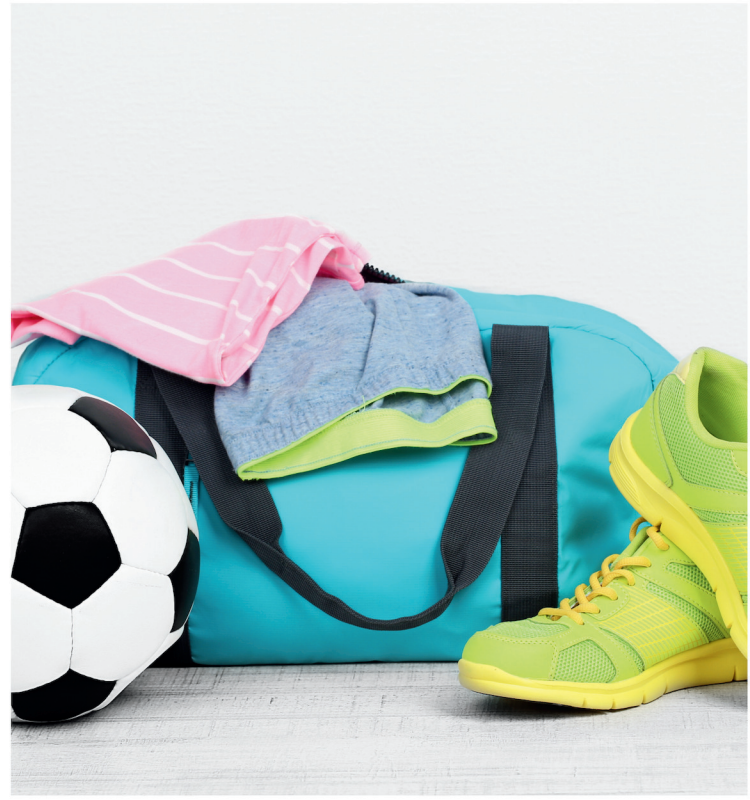
spremiti stvari za trening