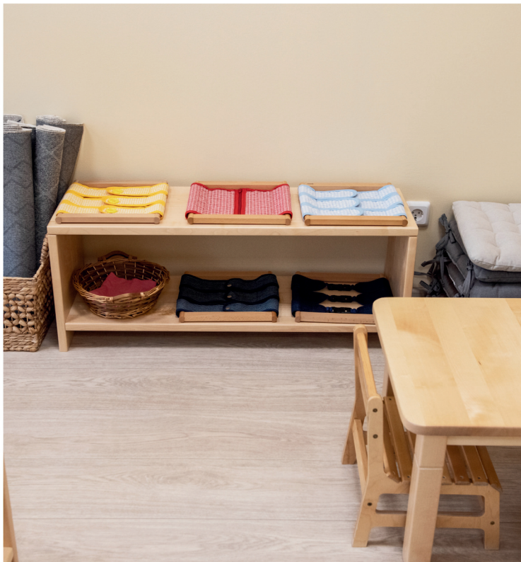
vratiti materijal na policu