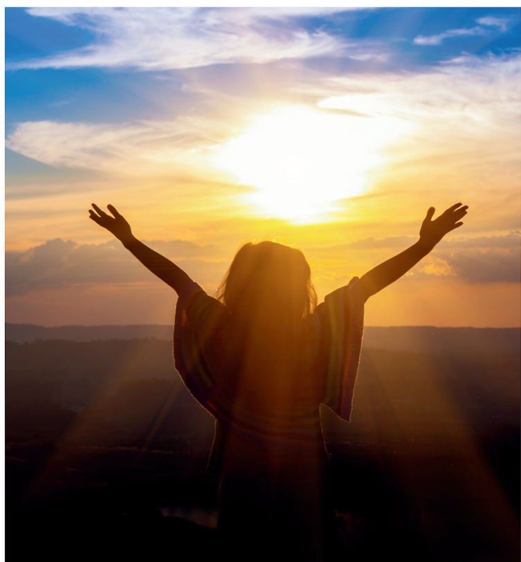
zahvaliti na danu