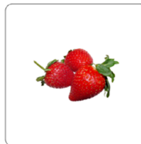
kartica sa slikom (tiha ili bezimena kartica)