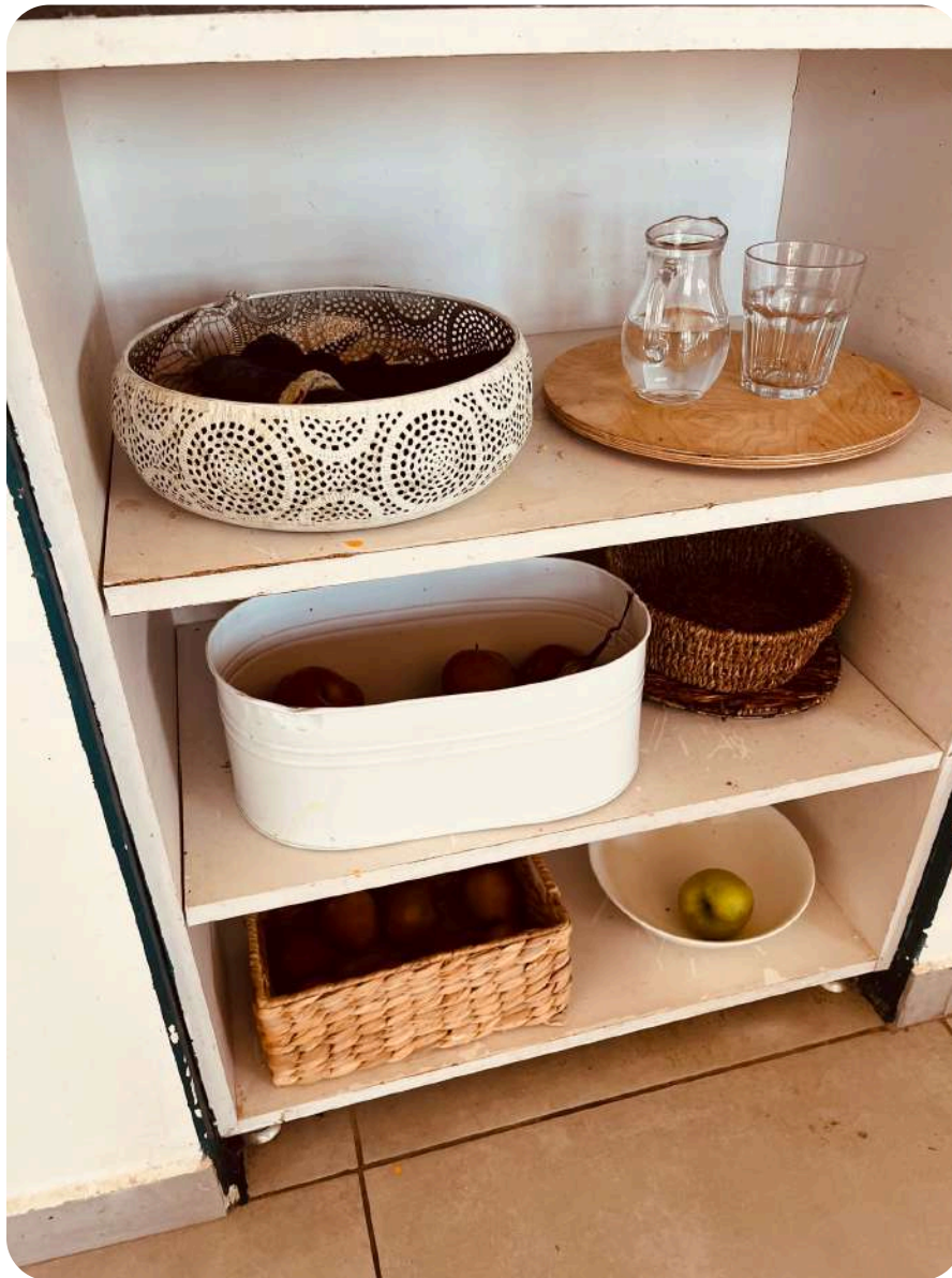
Kutak za ubruse, stanica za vodu, kutak za voće te pribor za postavljanje stola