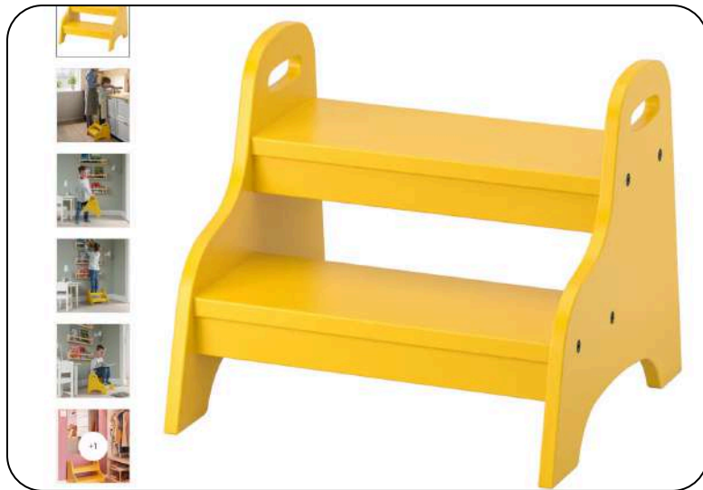
Ikea TROGEN dječji stolac sa stepenicom