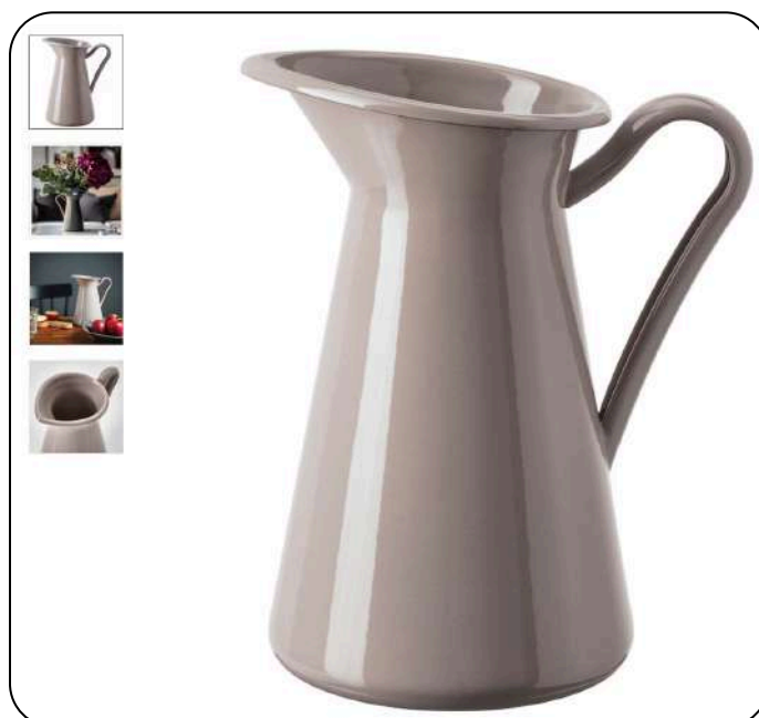
Ikea SOCKERÄRT vrč (koji nije od stakla)