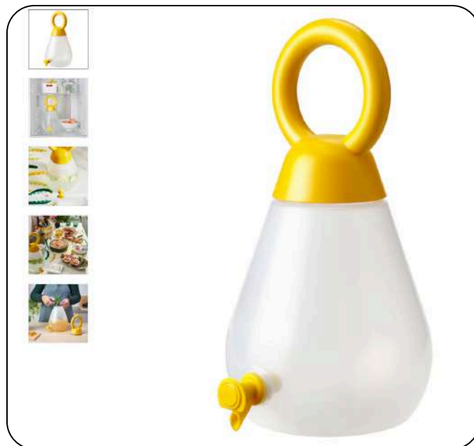
Ikea NÄBBFISK posuda s pipom