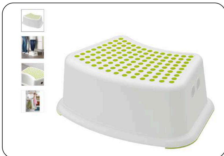
Ikea FÖRSIKTIG dječji stolac