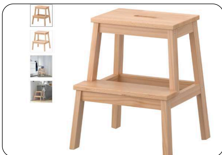
Ikea BEKVÄM prenosiva stepenica