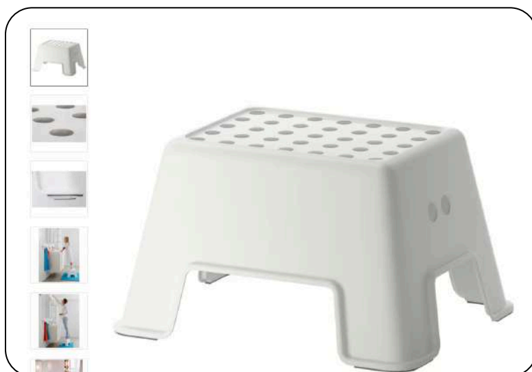
Ikea BOLMEN stolac sa stepenicom