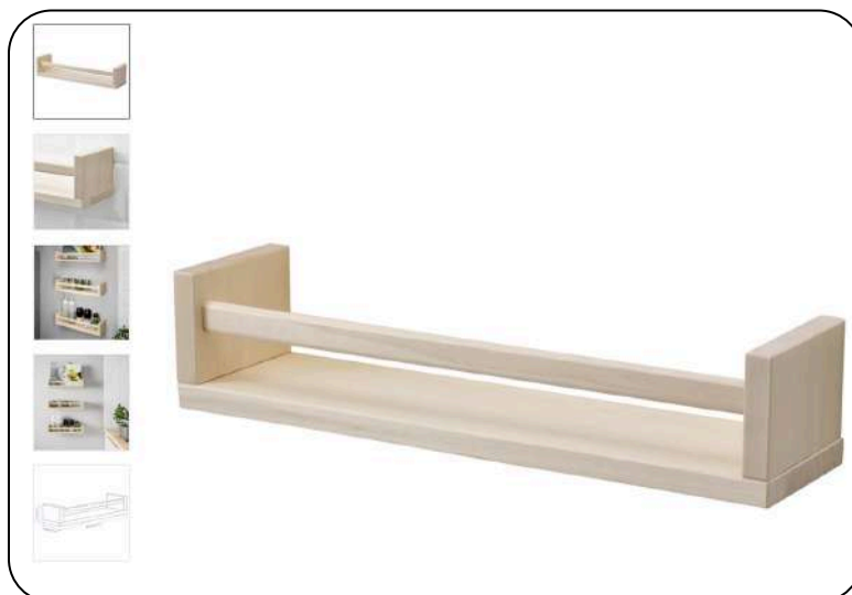
Ikea BEKVÄM stalak za začine (dovoljno lagan da ga možete zalijepiti za zid).