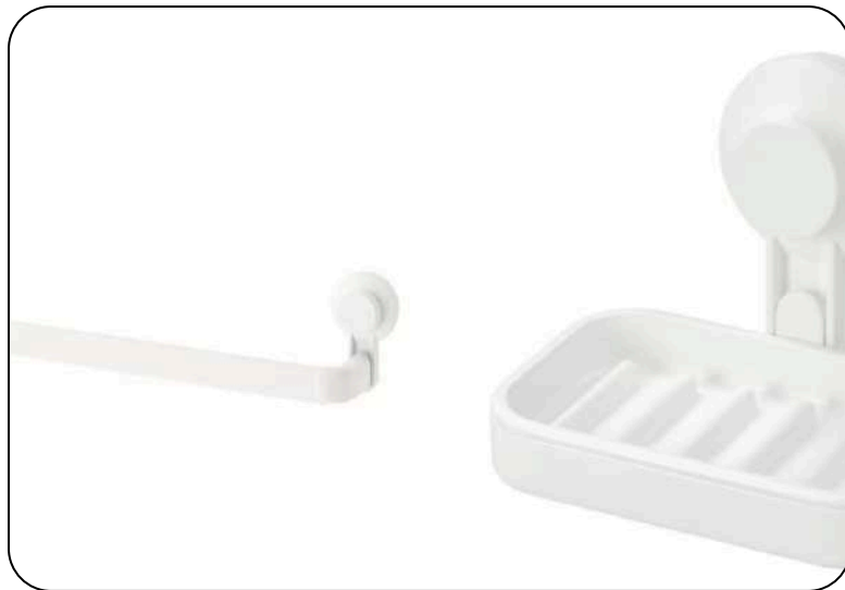
Ikea Tisken serija samoljepljivih dodataka