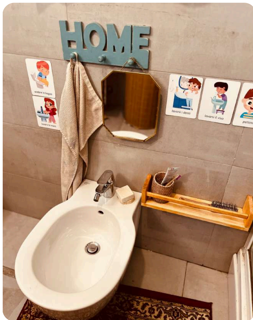
Pripremljena okolina za dijete u našoj kupaoni

Kada se dijete osjeća samopouzđano, tada prestaje tražiti odobrenje odraslih na svakom koraku. - Maria Montessori