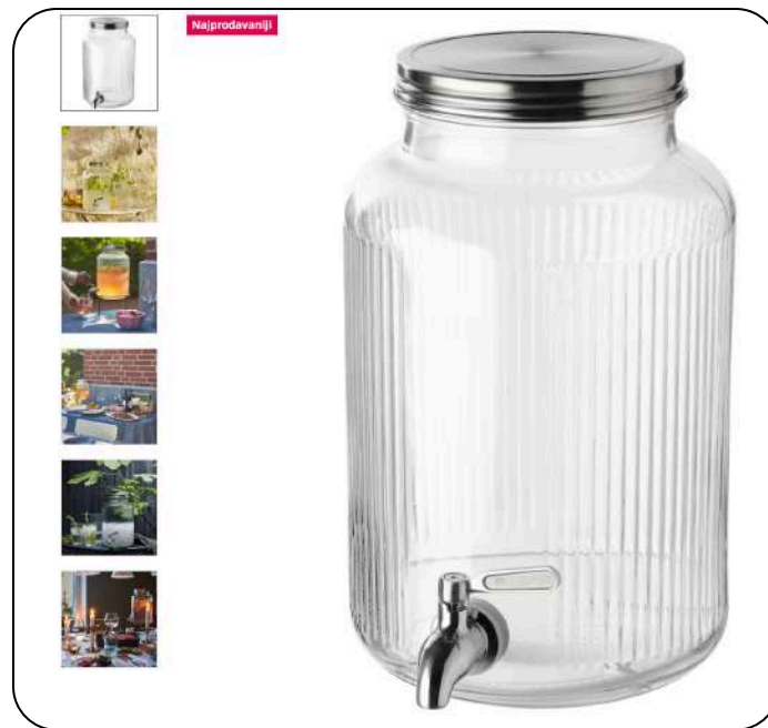
Ikea VARDAGEN posuda s pipom