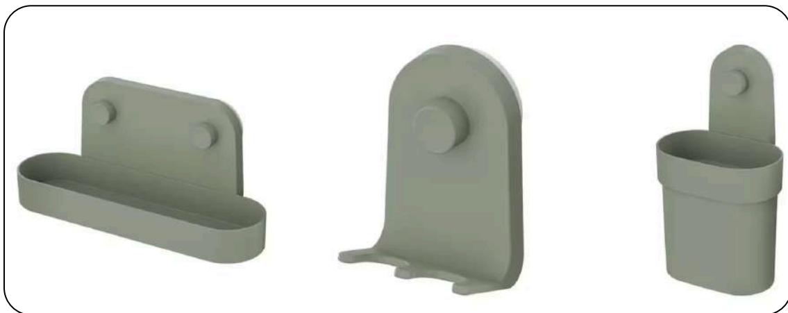
Ikea Obonas serija samoljepljivih dodataka