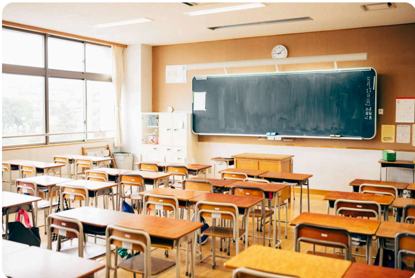
Primjer tradicionalne školske učionice

Ne možemo govoriti o Montessori filozofiji bez poznavanja njezine pedagogije. Ova lekcija pomoći će vam da razumijete razloge i smjernice Montessori pedagogije i da odaberete, ako se ikada dogodi, Montessori školu za svoju djecu savjesno i svjesno: jer ono što čini školu prije svega je priprema i obuka učitelja.