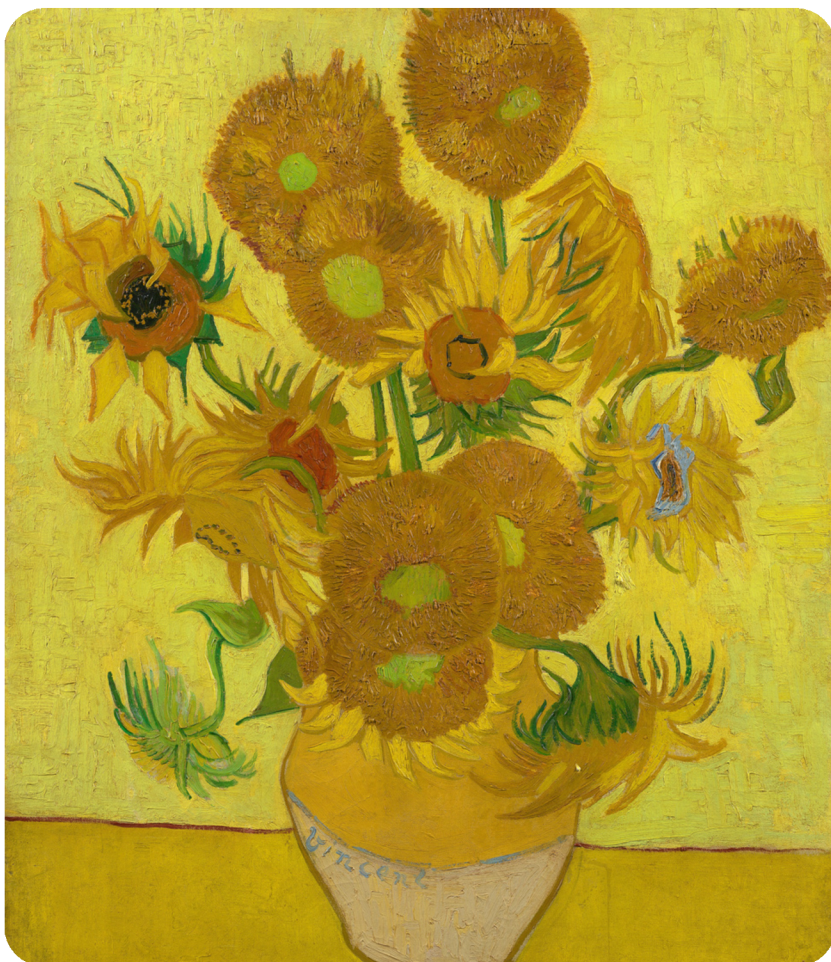
Vincent Van Gogh Sunflowers, 1889.