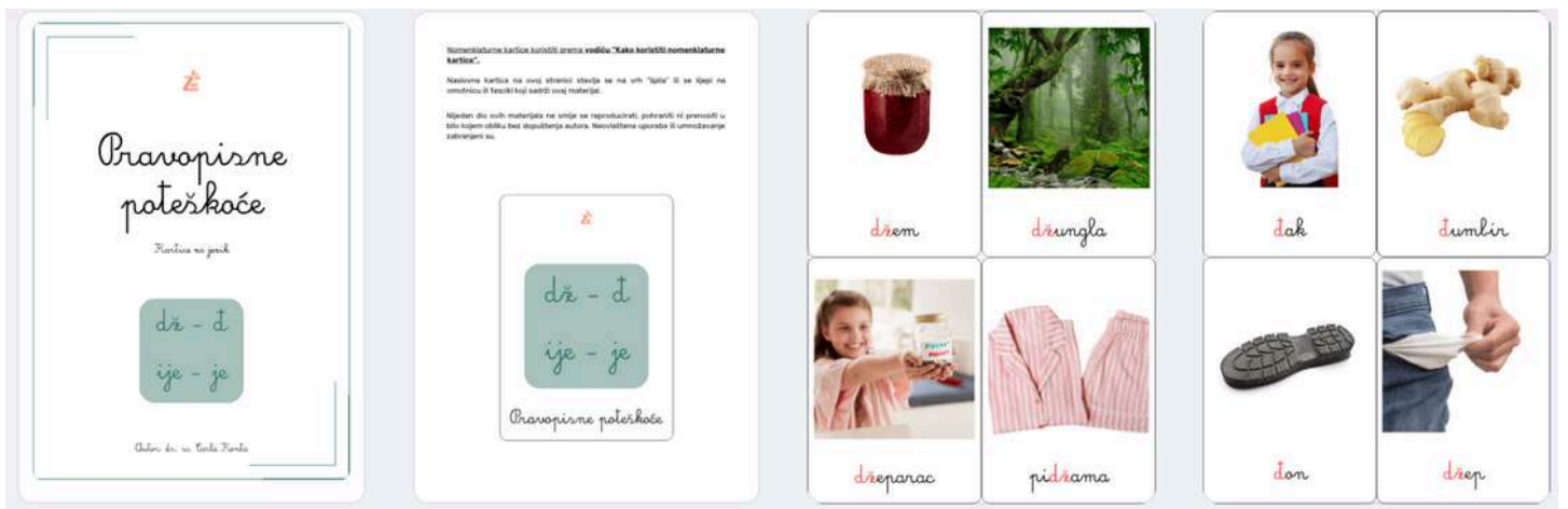
Kartice s pravopisnim poteškoćama (6+)

Uvijek testirajte aktivnost sami prije nego je ponudite djetetu.