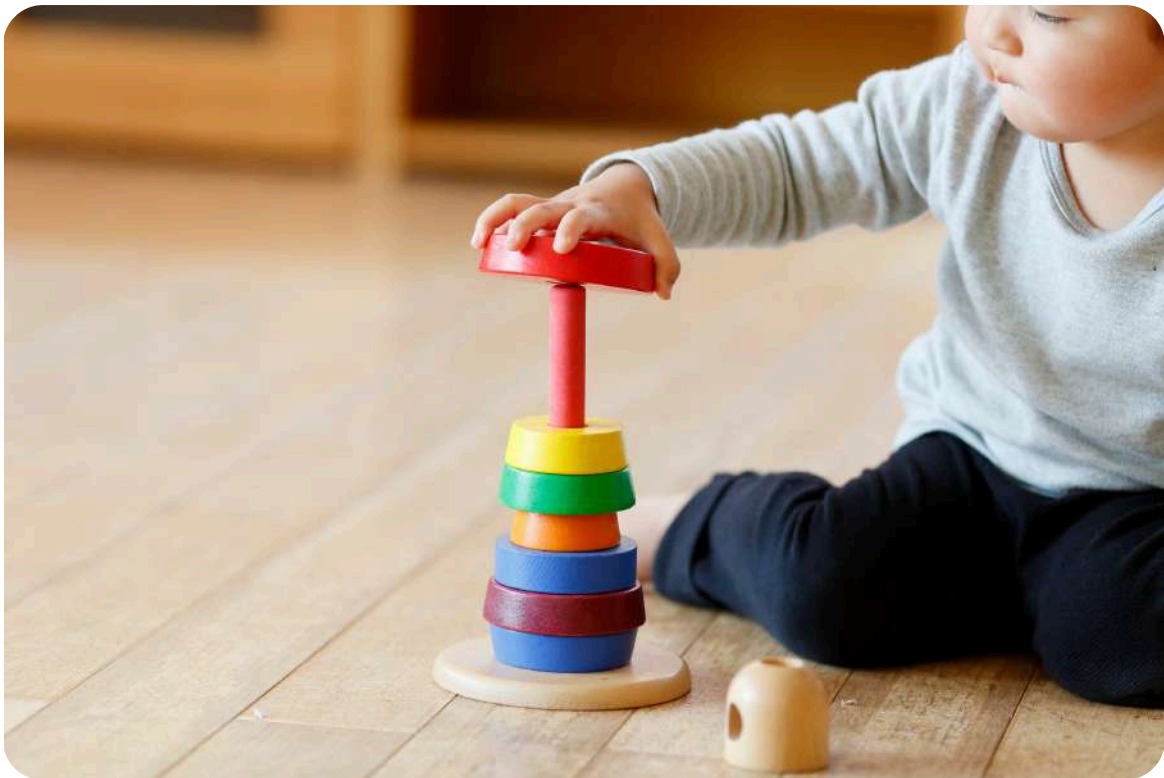
Beba usvaja predmatematičke vještine slažući obojene krugove na crveni štap.

U ovoj dobi nije cilj da dijete “zna brojati do 10”, nego da se polako razvija osjećaj za količinu i red. Zato su aktivnosti poput igre sa žetonima samo jedan oblik rada: one vizualno i taktilno pojačavaju ono što dijete već prirodno doživljava u svakodnevici. Kombiniranjem pjesmica, igre, žetona i promatranja okoline, dijete usvaja da iza broja stoji stvarna količina. Takav početak čini matematiku nečim bliskim, radosnim i prirodnim dijelom života.