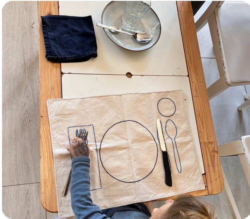
Vježba sa predloškom za postavljanje stola

Roditelji, jedući zajedno s djecom, pokazuju pravilno korištenje tanjura, pribora i čaša te sudjeluju u spontanom, emotivnom razgovoru. Djeca koja još razvijaju samostalnost mogu pripremati voće ili jednostavna jela za dijeljenje, što potiče finu motoriku i koordinaciju pokreta oko-ruka.